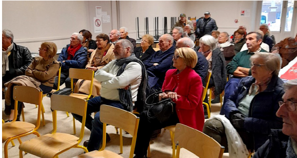
Un auditoire passionné

Au moment de nous séparer, en milieu d'après-midi, chacun était ravi de cette rencontre et nombreux étaient ceux qui souhaiteraient ramener d'autres anciens à participer aux activités de l'Association.