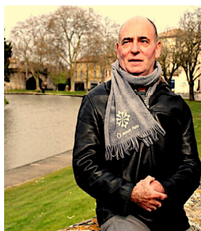
L'homme du canal...!

Les auditeurs, passionnés, n'ignoreront plus rien de sa conception, des techniques employées et des remarquables réalisations qui le soulignent : construction, alimentation en eau, écluses, tunnels, ponts, pont-canal et bien sûr en conclusion, la vie et la personnalité de Pierre-Paul RIQUET.