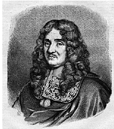
Celui à qui nous devons le canal