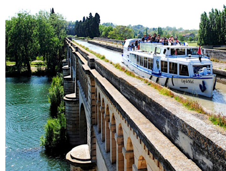
Le Pont-Canal de Béziers

Les applaudissements recueillis par notre conférencier sont largement mérités et nous accompagnent auprès d'un superbe buffet apéritif permettant de nombreux échanges et des retrouvailles animées.