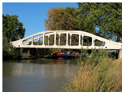
Le pont de Cers