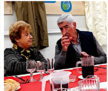
A table, discussions animées ....

Je terminerai ce bref compte-rendu, en ce début d'année, par mes vœux les plus vifs pour vous-mêmes et les vôtres. Malgré les difficultés qui s'accumulent, il faut garder espoir.